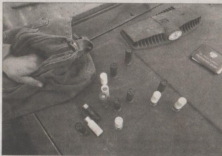
Проверка документов и оружия охотников — обычная составляющая работы по предотвращению нарушений.

— Следует признать, что в целом район стал чище. Особенно активно работы по уборке несанкциониро-